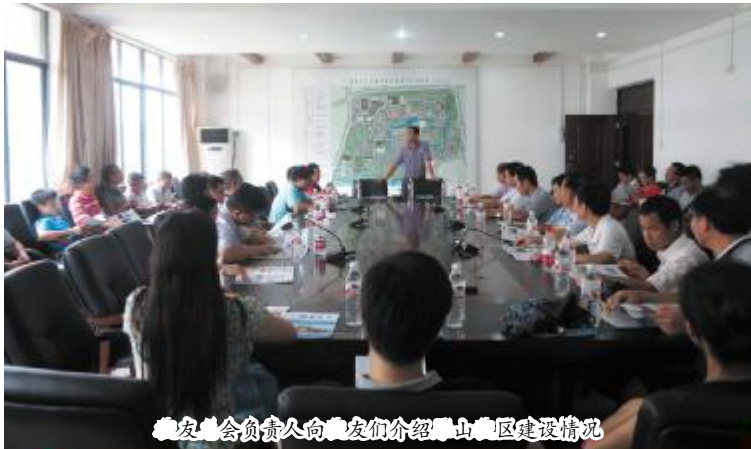
校友委员会负责人向校友们介绍雁山校区建设情况

7月26日至27日,' 数学J 90 h校&ol 校开展 4W ,&2 Z8 V4的S业 20 周年的 活动。在活动 H参i 了雁山校区,Xi 了校&. c 4OQRSOO于雁山校区] ^的=>。 尹小晴